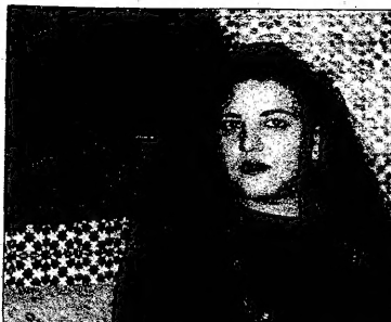
بغداد -القدس العربية- من خالد المغربي